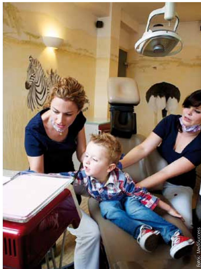
Der Pilot steuert

Eine handelnde Person wirkt bewusst und zielgerichtet auf ihre Umgebung ein und hebt sich in ihrem Auftreten und ihrer Klei-