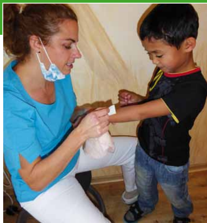
Das Aufkleben eines Tattoos als Belohnung

Nun beginnt die eigentliche Behandlung, in der alles geschehen kann. Dabei kommen neben den klassischen Elementen der Verhaltensführung, wie Desensibilisierung und Tell-Show-Do, die Techniken der verbalen und nonverbalen Kinderhypnose zum Tragen. Diese helfen, die einzelnen Behandlungsschritte optimal vorzubereiten, zu begleiten und zu unterstützen. Sie verlängern die Formel \text{Alter} \times 3 um den Faktor X, abhängig von den Behandlungsinhalten und den dazu notwendigen Schritten. Die Fertigkeit, Trance und Trancezeichen bei den Kindern zu lesen, zu interpretieren und zu lenken, ist gut in Fortbildungsangeboten und der Fachliteratur zu lernen.