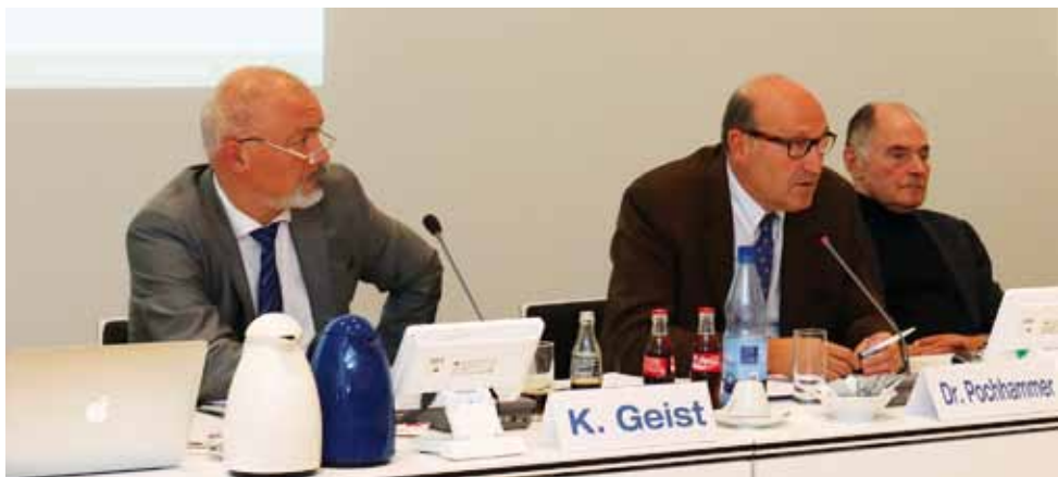
Das GKV-Selbstverwaltungsstärkungsgesetz war eines der Themen im Bericht des Vorstandes.

Aufgrund der Ende Juni bekanntgewordenen Maßnahmen des Bundesministeriums für Gesundheit (BMG) für ein Gesetz zur Stärkung der Handlungsfähigkeit und Aufsicht über die Selbstverwaltung der Spitzenorganisationen in der gesetzlichen Krankenversicherung (kurz: GKV-Selbstverwaltungsstärkungsgesetz) bat der Vorstand der KZV Berlin die Landesgruppe Berlin der CDU/CSU-Fraktion im Bundestag um ein