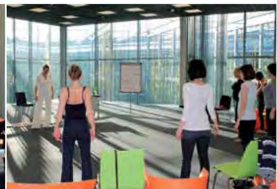
Fachthemen, Kommunikation und Yoga – die Workshops des 17. Berliner Prophylaxetages boten ein breites Spektrum für Interessierte.