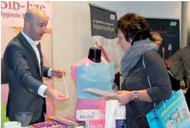
Qualifizierte und angeregte Gespräche – die Aussteller waren zufrieden mit dem Fachkongress.