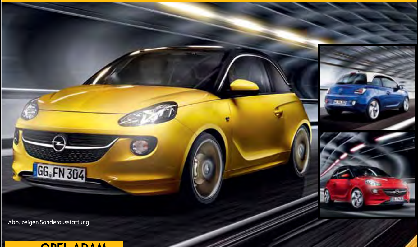
Abb. zeigen Sonderausstattung