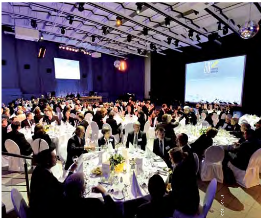
Der festlich geschmückte Festsaal