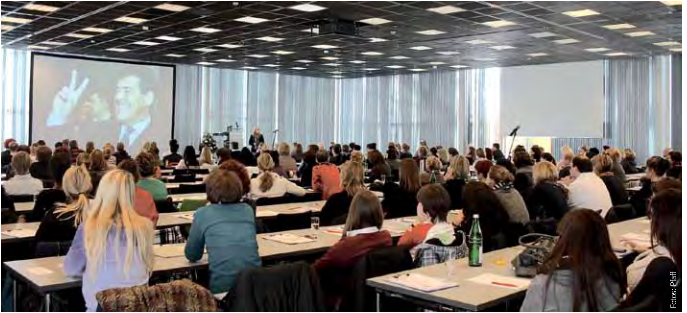
Prophylaxe bleibt spannend – auch der Vortragsblock am Samstag war wie in den vergangenen Jahren gut besucht.