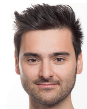
ZA U. Adali